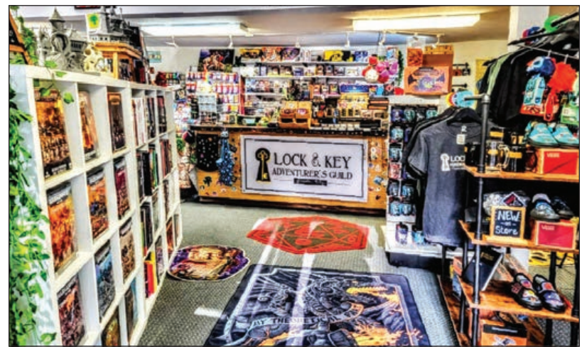
Equipos, suministros para pasatiempos, juegos de mesa, juegos de cartas coleccionables y mucho más están disponibles en Lock & Key Adventurer's Guild.