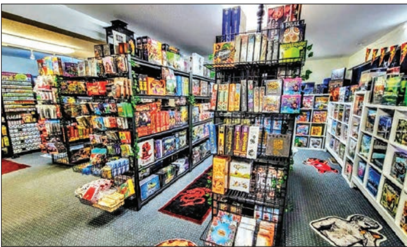
El interior de la tienda de juegos de mesa de Lock & Key Adventurer's Guild, mostrando su gran selección de suministros de juegos.