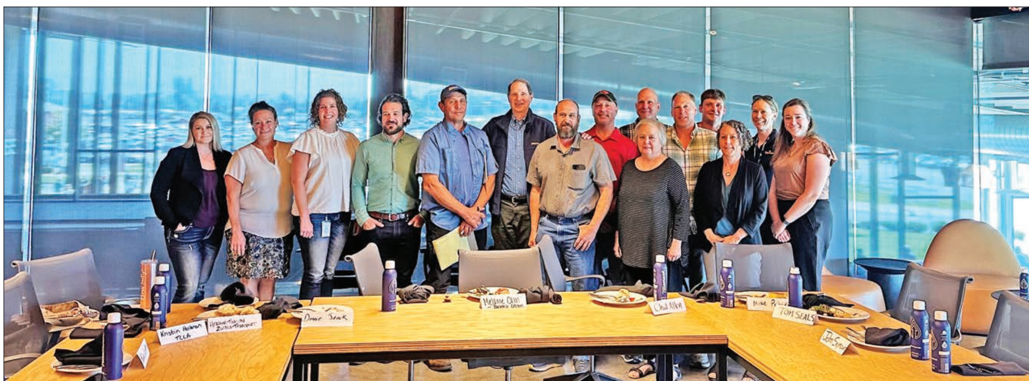
El Senador Ron Wyden (sexto desde la izquierda) posa para una fotografía con productores de leche, trabajadores de lecherías, camioneros y otras personas locales durante su visita a La Lechería de Tillamook el 8 de agosto.