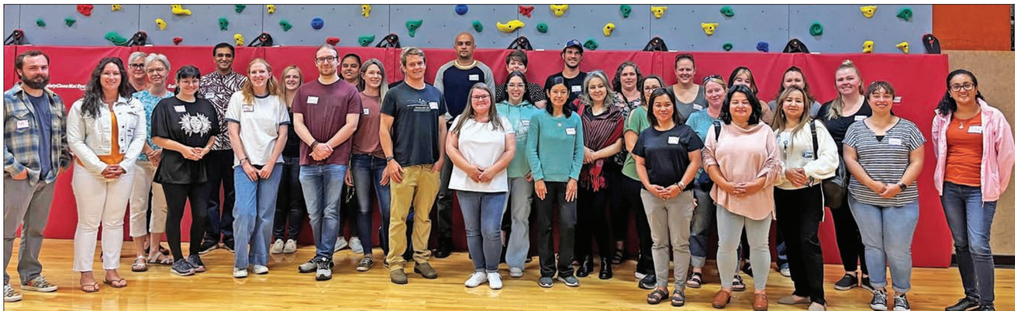
Los maestros y maestras nuevos del Distrito Escolar de Tillamook posan para una fotografía después del almuerzo en la Escuela Primaria Liberty.