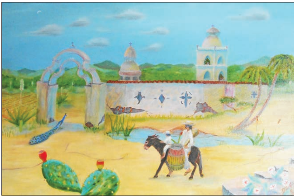
Cuadro de Óleo "Padre y hijo" de Dago Benavidez. CONTRIBUIDO POR DAGO BENAVIDEZ