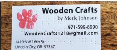
Tarjetas de impresas de Wooden Crafts que cuentan con braille en la parte posterior para aquellos con discapacidades de vista.