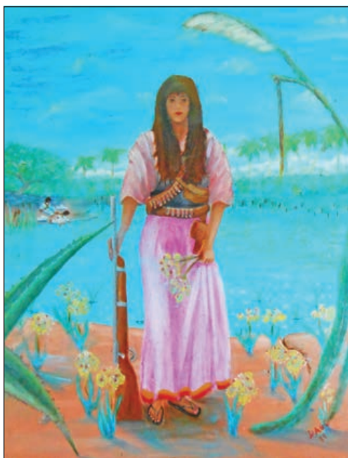
La pintura de Benavidez que representa a las "mujeres de Las Adelitas en el ejército de Pancho Villa que tomaron el poder de combates cuando sus maridos murieron en la batalla". CONTRIBUIDO POR DAGO BENAVIDEZ