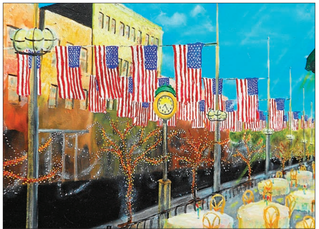
"La calle Larimer en Denver, la calle más antigua de allí", pintada por Dago Benavidez. CONTRIBUIDO POR DAGO BENAVIDEZ