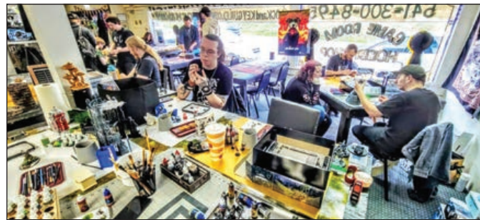
La tienda de pasatiempos está llena de clientes que pintan y juegan en el gran espacio de juego abierto del almacén.