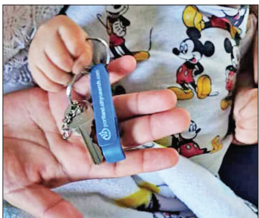
Una de las familias que recientemente se graduó del programa fue una familia multigeneracional compuesta por una abuela, una hija y un recién nacido. Este fue un momento de orgullo para todos los que ayudaron con que la familia llegue a este punto.