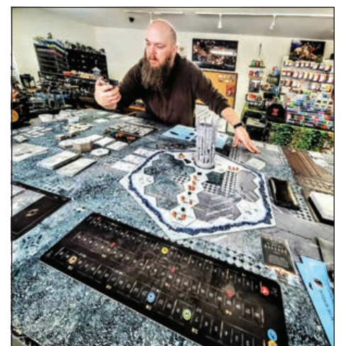
Algunos suministros para juegos de mesa que se utilizan dentro del espacio increíble de juegos de la tienda, creados para el uso de los clientes.

Por SARAH KELLY Para Country Media, Inc.