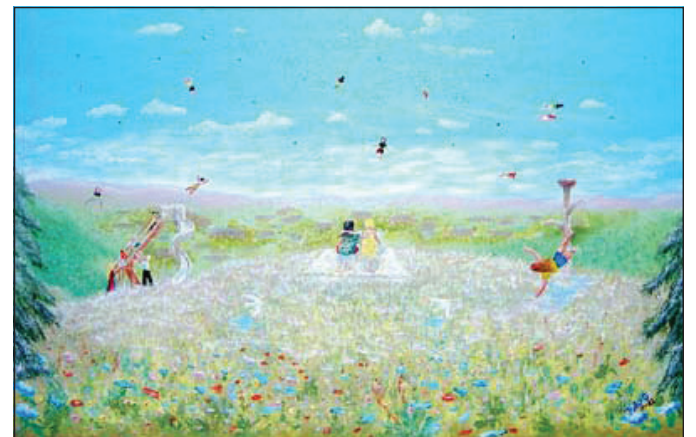
Un cuadro pintado de óleo por Dago Benavidez, que representa a niños en distintas etapas del proceso judicial sistema judicial. Los niños voladores son los que han encontrado hogares estables y han sido ayudado por los defensores de CASA. Los dos niños sentados son los que esperan recibir ayuda de un abogado. CONTRIBUIDO POR DAGO BENAVIDEZ

que el Consulado Mexicano en Portland, Oregon, tradujera la porción en español de libro. Quería "asegurarse de que estuviera aprobado adecuadamente", lo que le permitiría colocar su sello dentro de sus páginas. Dijo que cualquiera que quiera comprar el libro puede comunicarse con él a través de correo electrónico a: DagoBenavidez@gmail.com. Mientras tanto, está trabajando para hacerlo más fácil accessible a todos.