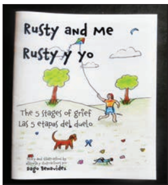
La portada del libro infantil de Benavidez sobre las cinco etapas del duelo. "Rusty and Me" está en ambos Inglés y español y está dirigido a niños pequeños, pero también es una lectura buena para cualquier edad. CONTRIBUIDO POR DAGO BENAVIDEZ

minada realmente", añade, afirmando que mira hacia atrás, a una pieza terminada, sólo para darse cuenta que sentía que podía haberle añadido más cosas.