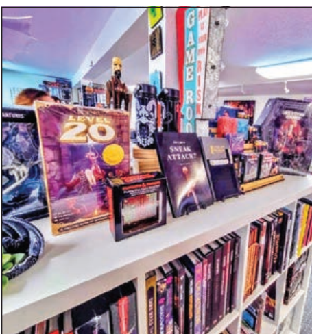
Lock & Key Adventurer's Guild ofrece una gran selección de varios libros sobre juegos y otros suministros para pasatiempos.