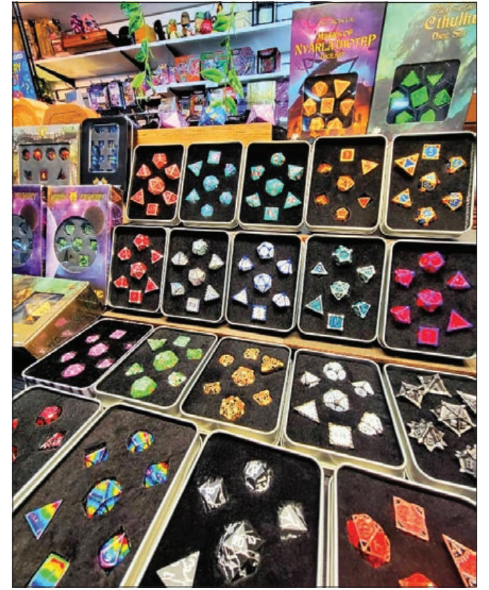
Algunos de los dados hermosos especiales que ofrece la tienda local de juegos de mesa.