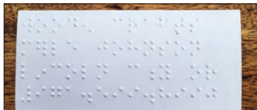
Para Merle Johnson era importante que el reverso de las tarjetas de impresas de Wooden Crafts estuviera en braille, haciéndolos fácilmente legibles para personas con discapacidades de vista.

Por SARAH KELLY Para Country Media, Inc.