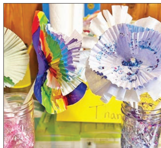
Arte creado por los niños de las familias de Promesa Familiar del Condado Lincoln ayuda en uno de sus recientes eventos de Noche de Artes.